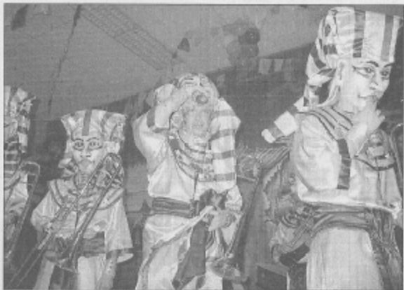
Die Pharaonen der „Schapfe-Clique“ weckten selbst die ältesten Mumien.