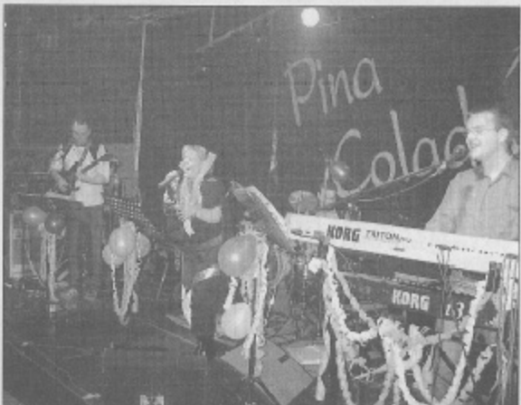
Die Band „Pina Colada“ sorgte für Stimmung bis in die Morgenstunden.